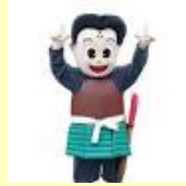
松浦市の ゆるキャラ 松浦 松之介