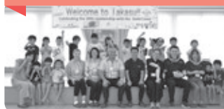
鷹栖保育園にて行われた「英語であそぼう」の様子を視察しました。ALTの姿を見た市長は、称賛の声を送りました。