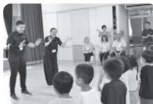
園児たちから「ウェルカム トゥ タカス！」。お別れには「シー ユー アゲイン！」の言葉が響き渡りました。