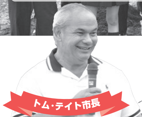
トム・テイト市長

町内企業を通じた縁から、当時のアルバート市との友好交流が1991年に始まる。ホームステイや学生交流が軌道に乗った頃、同市がゴールドコースト市と合併。これまでの関係を継続する形で、交流相手をゴールドコースト市へ引き継ぐこととなった。1995年11月18日、ゴールドコースト市公式訪問団が鷹栖町を訪問。両市町長が署名し、正式に姉妹都市として提携。交流は新たな段階へと入る。