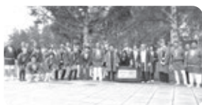
いい汗を流した後は、集合写真