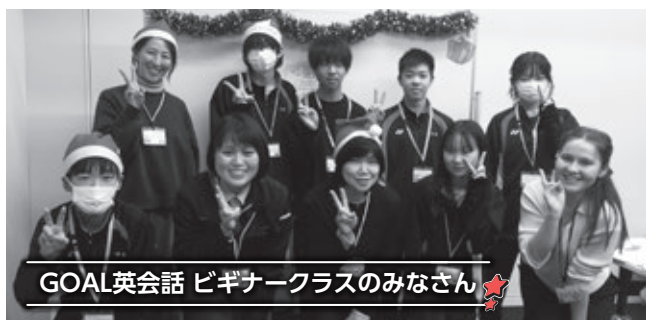
GOAL英会話 ビギナークラスのみなさん

Thank you for the fun classes and good luck with your English studies!