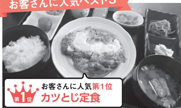
第1位 お客さんに人気第1位 カツとじ定食