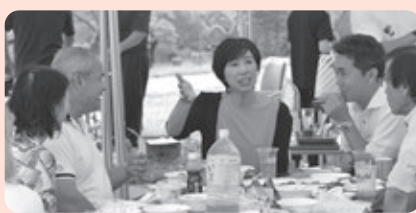
「鷹の翼」協力のもと、鷹栖牛などを用意してバーベキューを開催