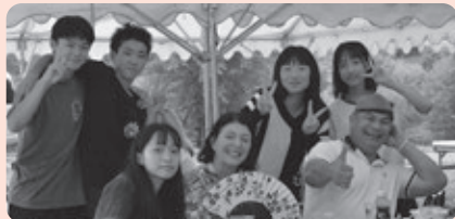
鷹栖中学生（GC訪問団）も参加し、笑顔あふれる時間になりました