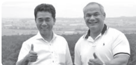
パレットヒルズ展望台で記念撮影