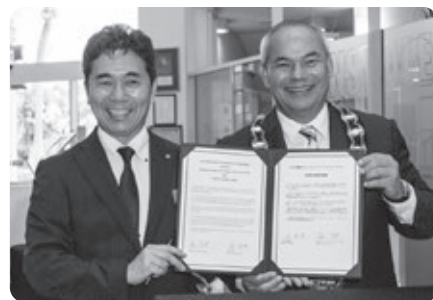
後ほど再度署名し、無事提携完了