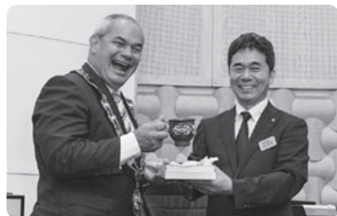
鷹栖町へ、アボリジニ文様の陶器のティーセット。谷町長へ、ライフガードシャツ。