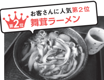
第2位 お客さんに人気第2位 舞茸ラーメン