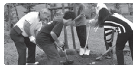
姉妹都市提携30周年を記念して「友好の木」を植樹