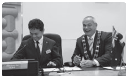
トム・テイト市長が谷町長の欄にサインしてしまうハプニングもありましたが