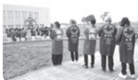
嵐山の皆さんが神輿を担いで登場