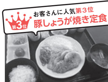
第3位 お客さんに人気第3位 豚しょうが焼き定食