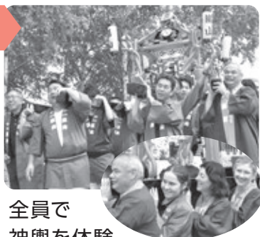
全員で神輿を体験