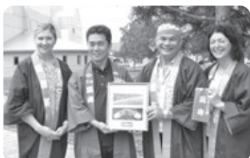
プレゼント交換が行われました！鷹栖町からは、町のロゴ入り半纏をプレゼントしました。