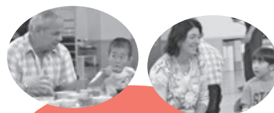
園児と一緒に給食を食べました