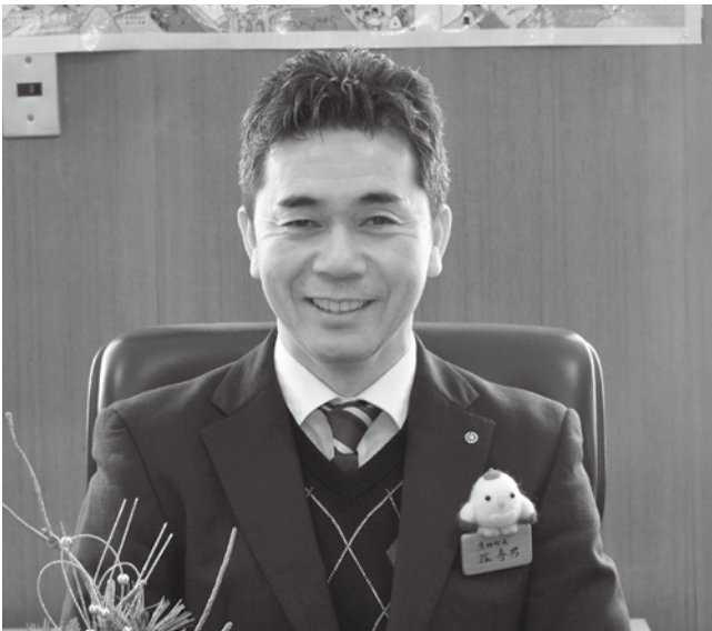
鷹栖町長 谷 寿男

広報1月号と一緒に『令和5（2023）年鷹栖町民カレンダー』を各家庭に1部配布しています。追加が必要な場合は、お手数でも役場へお越しください。郵送などの対応はしておりませんのでご了承ください。