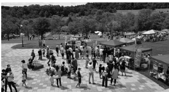
▲にぎわいを見せたパレットヒルズ夏まつり

結びになりますが、町民の皆さまのご健勝と実り多き1年となりますよう心よりお祈りし、新年のごあいさつといたします。