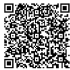
▲事業詳細 (町ホームページ)

▼その他 支援金の内容や申請書などは町ホームページまたは産業振興課商工観光係へお問い合わせください。