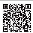
▲みんなのストレッチ参加申込フォーム