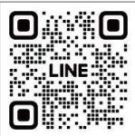
▲町公式 LINE お友だち登録