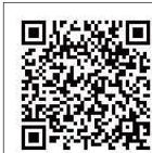
▲ふらっとキッチン参加申込フォーム