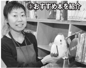
③おすすめ本を紹介

▶大好きなトマトの本に囲まれて幸せ♪広めのテーブルと椅子が用意された閲覧スペースでゆったりと読むことができたよ！