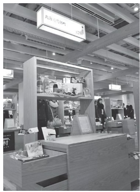
▲「おすすすめふるさと」にある鷹栖町のブース。参加自治体すべてに同じ広さのスペースが割り当てられています。ブースには、販売する特産品が陳列されているほか、自治体の写真や映像も投影されていて、裏側にはパンフレットを配架する棚も。

るレストラン、移住やふるさと納税の相談窓口も設置しています。自治体の出展スペース「おすすすめふるさと」は3階にあり、鷹栖町をはじめ全国16市町村1団体が、それぞれ約3メートル四方のブースに特産品を並べて販売するとともに、パンフレットや映像を使って地域の魅力をPRしています。 まるごとにつぼんへの出展は、初期費用や運営費を施設側が負担するため、従来のアンテナショップに比べて大幅に費用を抑えられることがメリットの一つ。町は賃料を支払って運営を施設に委託し、商品の販売や発注は施設職員が行います。 また、ワンフロアの同じ空間に北から南まで特徴が異なる全国各地の特産品が揃うことは、消費者にとっ