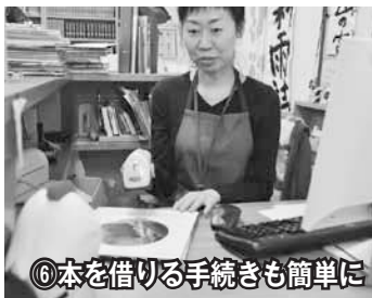
⑥本を借りる手続きも簡単に

▲図書室では調べもののお手伝いもしてくれるんだって。家庭菜園を始めるための資料を探したいと言ったら、色々なジャンルから関係のある本を集めてきてくれたよ！自分で探すと大変・・・