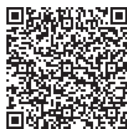
▲どさんこアウトメディアプロジェクト アイテム

北海道教育委員会では、保護者や児童生徒が望ましいネット利用を進めるために様々なアイテムを作成しています（以下のQRコードからアクセスしてご利用ください）。ぜひ、全ての教育の出発点である家庭において、家族の団らんや親子のコミュニケーションの機会を増やしたり、家庭のルールをつくったりすることにご活用ください。さらに、家庭を支える地域が一体となって取り組み、子どもたちにネット利用も含めた望ましい生活習慣を定着させることを目指していただければと思います。