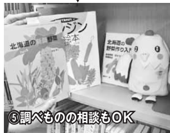
⑤調べものの相談もOK

▶たくさんの本のなかから、僕の好みに合いそうな本をすぐに見つけて紹介してくれたよ！少し読んで気に入らなければ、違ったジャンルも紹介してくれるんだって。