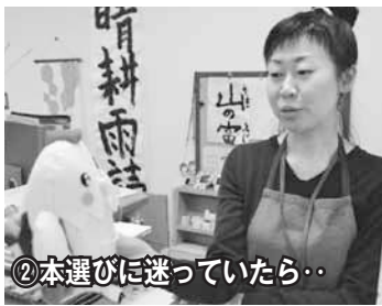
②本選びに迷っていたら・・・

▶まずは本を借りるためのカードを作成。カウンターで申込み書に記入して、その場ですぐに発行してくれたよ！