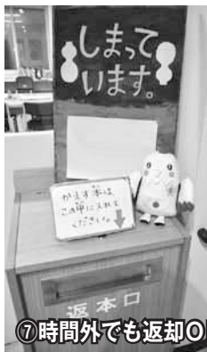
⑦時間外でも返却OKで安心

▲気に入った本は、1人5冊まで2週間借りることができるんだって。カウンターでバーコードを読み取るだけで受付は完了。台帳に記入するのと比べて短時間だしプライバシーも守られるね！