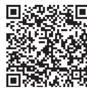
▲ネットトラブル未然防止のための総合ヘルプサイト