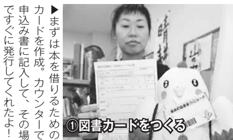
①図書カードをつくる

▶まずは本を借りるためのカードを作成。カウンターで申込み書に記入して、その場ですぐに発行してくれたよ！