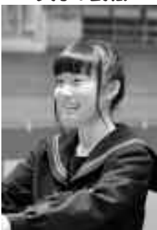
3月13日 鷹栖中学校卒業式