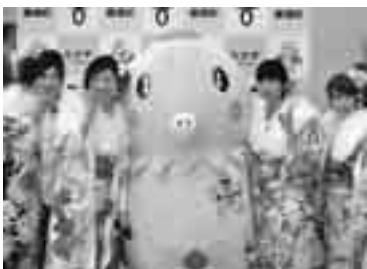
新成人たちといっぱい写真を撮ったよ☆