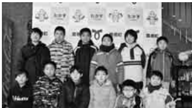
松浦市訪問団と鷹栖町の子ども達、お別れ会での1枚