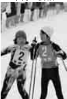
1月18日 たかすオオカミの里 北野クロスカントリー大会