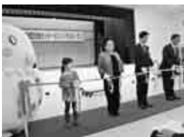
テープカットに参加したよ♪