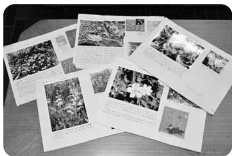
女満別小学校勤務時代に作成した標本

昭和52年、女満別小学校に勤務していたときに、女満別湖畔に珍しい植物が多かったこともあり、子どもたちのために植物を紹介する簡単な写真標本を作成。その頃、「いつか植物を紹介する本を出版できれば」という夢を持ちました。しかし、教員生活をしながらの執筆は難しく、心の中にその想いをしまっていました。