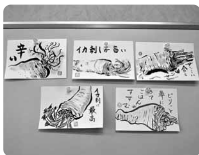
同じ山わさびでも描き方はさまざまです。

作品でも色々な見方があり、 全ての絵に個性があります。 伊藤先生は「最近では作品 を見れば誰が作ったものか、 わかるようになっていま す」と話します。