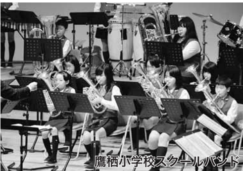
鷹栖小学校スクールバンド