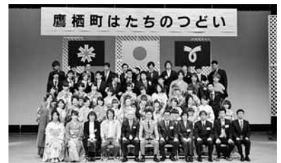
鷹栖町はたちのつどい

※詳しくは鷹栖町ホームページにて、寄附者の同意をいただいた項目を公表しています。