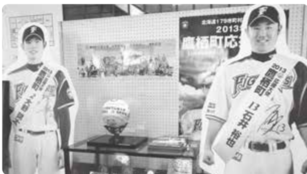
役場への記念品としてビッグボールをいただきました!

▶ 記念のビッグボールは、役場ロビーに展示しています。等身大パネルには直筆サインも。