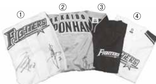
ファイターズ応援大使サイン入りグッズ(各1名)

あつたかすクイズは全部で15問。様々なイベントを思い出しながら、全問正解を目指しましょう!クイズのヒントは、今月号やこれまでの広報紙、さらには鷹栖町ホームページに隠されています。家族そろってお楽しみください。 ※クイズの正解は、次号の広報たかすに掲載します。