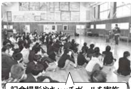
記念撮影やキャッチボールを実施。子どもたちの作品も贈呈しました。