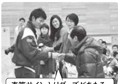
直筆サイン入りグッズがあたる抽選会では選手から景品贈呈!