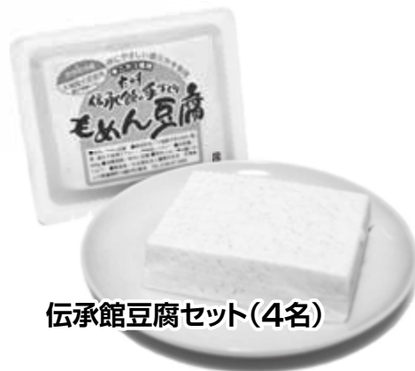
伝承館豆腐セット(4名)