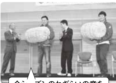
今シーズンのねぎらいの意を込めて鷹栖町の新米を贈呈。