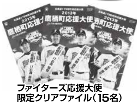
ファイターズ応援大使限定クリアファイル(15名)

※準あつたかすマスター賞は、全問正解の方で上記抽選に外れた方および10問以上正解された方を対象といたします。