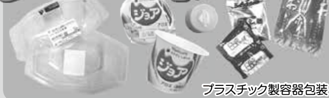
プラスチック製容器包装