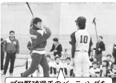
プロ野球選手のバッティングを直接見ることもできました。