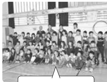
学年ごとに記念撮影!

▶ 記念のビッグボールは、役場ロビーに展示しています。等身大パネルには直筆サインも。