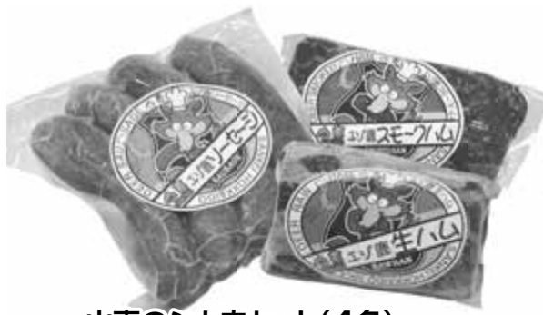
山恵のシカ肉セット(4名)