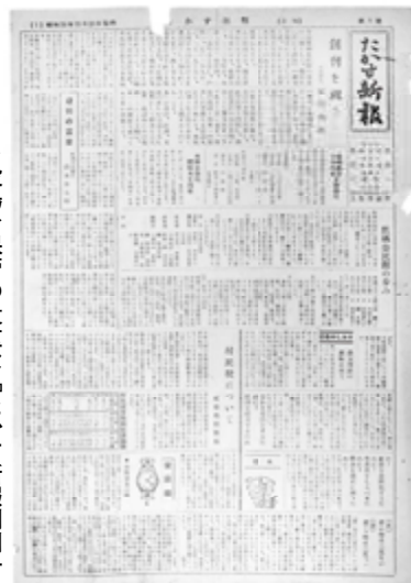
▶役場で保管の貴重な『たかす新報創刊号』

創刊当時の名称は『たかす新報』。鷹栖公民館の事業の一端として発刊され、発行日は昭和24年11月20日。約70年前のことです。