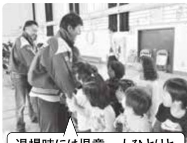
退場時には児童一人ひとりとハイタッチをしてくれました。