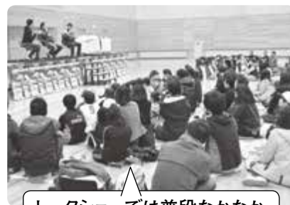
トークショーでは普段なかなか聞けない話も盛りだくさん!