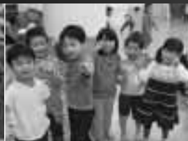
お迎えがくるまで もうひとあはれ!!!