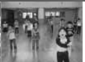
「よっちゃれ」の 練習中!