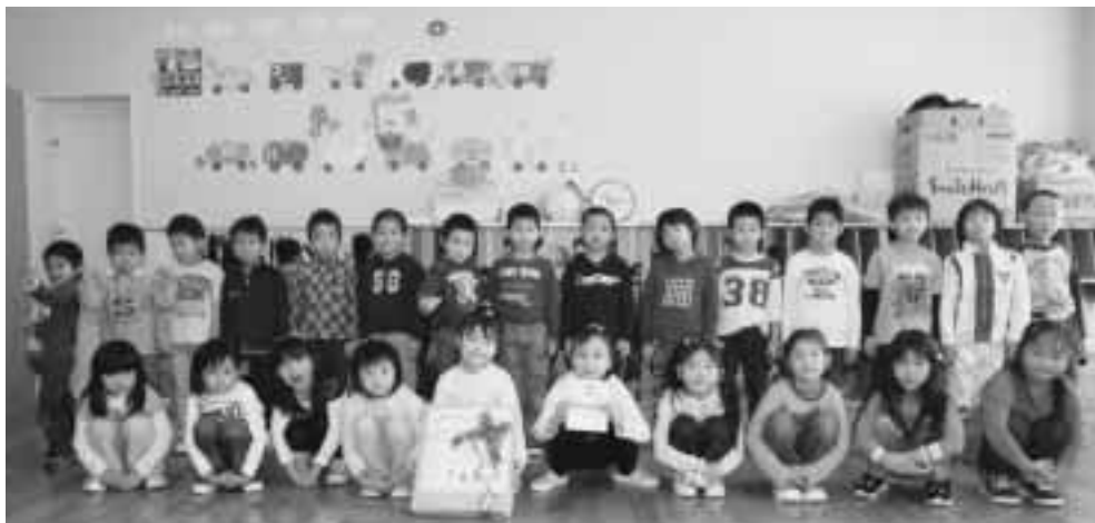
開園式で受けとった絵本の目録を手に、にっこり笑顔のすみれ組のみんな。