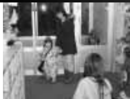
先生さようなら また明日～

PM5:00 ~ お迎え PM3:45 自由あそび PM1:00 午睡 AM11:30 給食