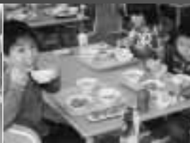
たかあのお米は おいしいな～♪