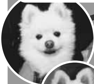
シユープくん ♀10才 (ポメラニアン)