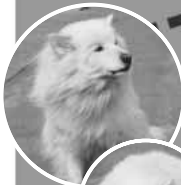
ノンくん オス・14才 (雑種)

おとなしい性格ですが、「超」の付くほど臆病で、花火や雷など大きな音が出るものがとっても苦手なんです。怖いときは大人しくしていればいいのですが、何かあると暴れまわって大変。私が留守にしていたとき、家の中のカーテンを切り裂いて、それに自分も絡まってしまって、宙吊りになっていたこともあるんですよ。