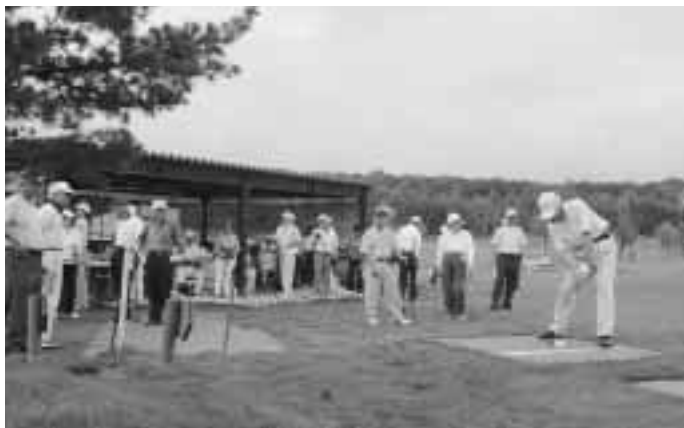
平成19年8月開催の第1回大会