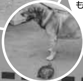
ボスくんと仲良し クサガメのクマちゃん