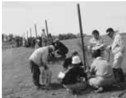
パレットヒルズ植樹祭

を応援したいという皆さんの善意を形にさせていただくための取り組みであり、決して寄附を強要したりするものではありません。