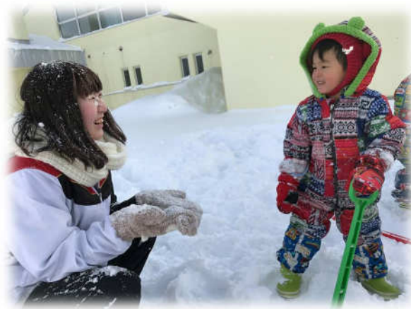
▲町内保育園との交流（ボランティア体験）