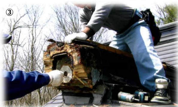
①アーク溶接作業 ②町内事業所の作業場 ③屋根の修繕