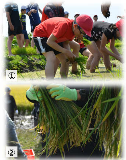
①田植え体験 ②収穫の秋

近年は、牧草や麦類、豆類の作付面積が増加しています。また、平成29年の水稻の作付割合は、ななつぼしが39.8%、ゆめぴりかが26.3%、きらら397が27.8%でした。