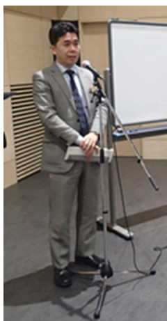
谷町長のあいさつ

第1回「つくる会」では、基礎的な統計データ（人口など）や「町民アンケート調査」の結果など、これからの鷹栖町を考えるために必要なデータについての情報提供がありました。また、鷹栖町においてさまざまな活動に取り組んでいる3人の町民の方にご登壇いただき、鷹栖町での暮らしと仕事、そして将来の夢について語っていただきました。それらを受けて、参加者35人全員で「鷹栖町での暮らし」と「10年後の鷹栖町で、自分はどうありたいか」についてワークショップを行いました。