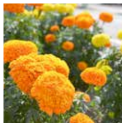
町花／マリーゴールド 昭和 47 年 1 月 1 日制定