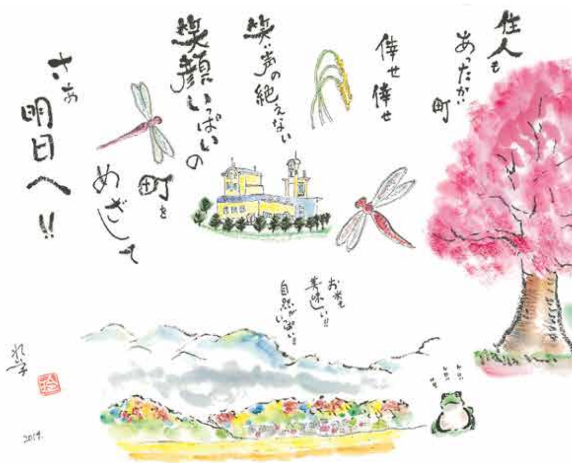
「この鷹栖・このまちが好き!」坂根玲子さん作 町制50周年記念 鷹栖町総合振興計画イメージ作品グランプリ