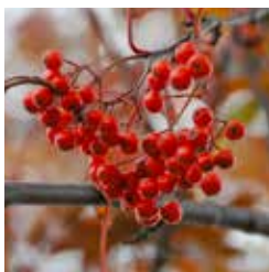
町木／ななかまど 昭和 47 年 1 月 1 日制定