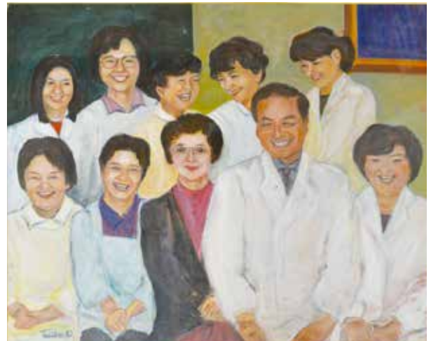
▲ 「30年前」 大上戸敏子さん作 (油彩画)