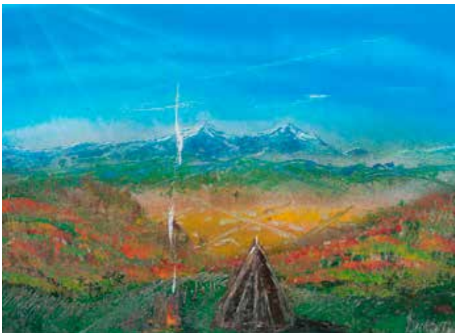
▲ 「大雪山 camp (パレットヒルズにて)」 banaさん作 (スプレーアート)