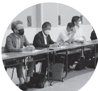
北野会場では比布町議会の皆さんが見学されました

3年ぶりとなる地域を語るう会は、テーマを「適正な議員定数と報酬を考える」としました。皆さまからいただいた多くのご意見は、今後の議員間討議の資料として活用させていただきます。今後も鷹栖町議会に対して多種多様なご意見をいただければ幸いです。