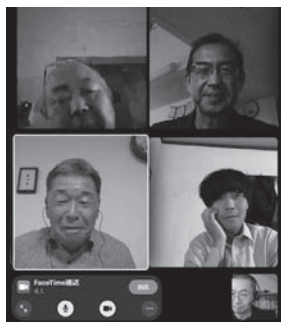
オンライン語ろう会も実施

鷹栖町議会では定数や報酬について、議会として十分な活動をするためにはどうあるべきか、検討してきました。昨年11月には議員全員での協議の結果を報告としてまとめました。これをたたき台として、町民の皆さんにご意見を伺い、議員定数等特別委員会で協議を行い令和4年9月に結論を出す予定です。