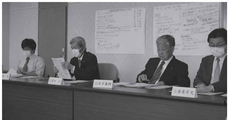
「地域を語ろう会」の記録用模造紙を見ながら協議しました