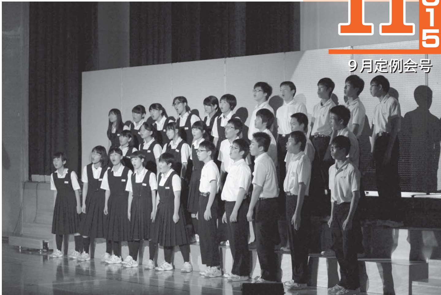
鷹中祭 合唱コンクール