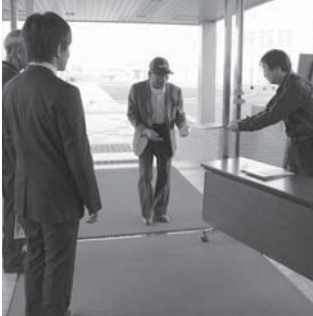
メロディーホールボランティアスタッフ

より安い料金で文化に触れる機会を提供するという点で、有名な人を多く呼ぶというのは難しいです。