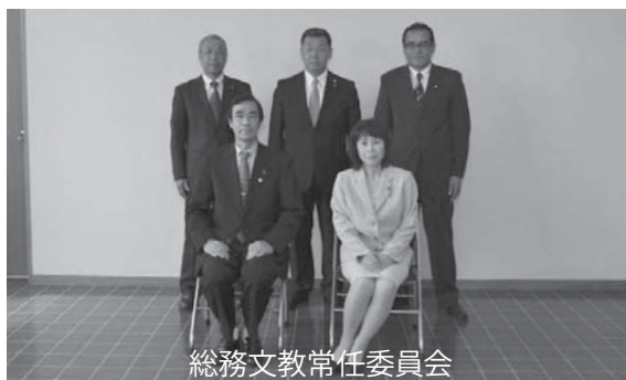
総務文教常任委員会