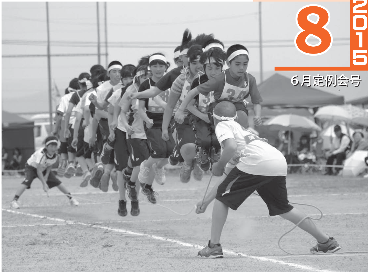
第33回鷹栖中学校体育大会