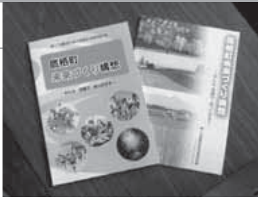
第7次鷹栖町総合振興計画