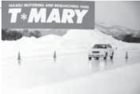
横浜ゴムテストコース