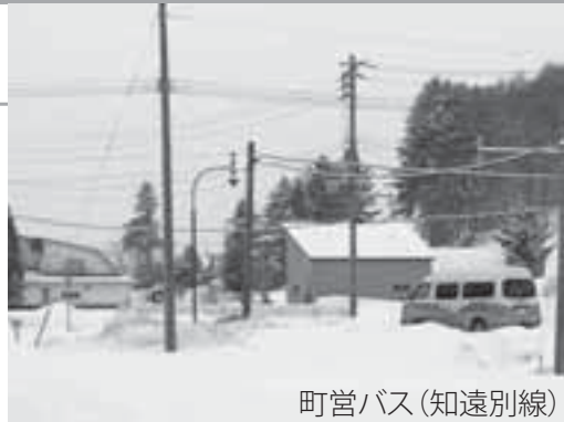
町営バス(知遠別線)

町 営バスの鷹栖循環線の始発便と最終便は利用率が30%を割り込んでいる。予約運行に切り替える考えは。