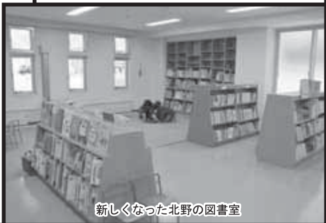
新しくなった北野の図書室

A. 教育課参事 役割が 違うので合同会議は持って いません。今後、住民セン ターの改築もありますので、 両協議会にも相談していき ます。