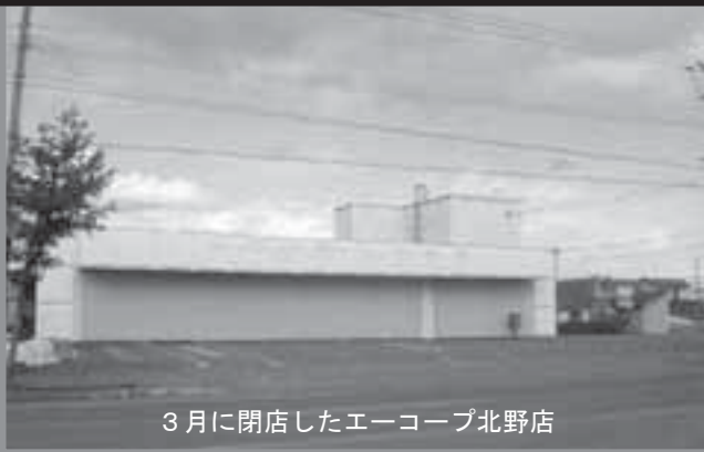
3月に閉店したエーコープ北野店

A. 健康福祉課長 今までは地域活動支援センターや障がい福祉サービス事業所が対象でしたが、新たに病院通院、デイケア通院などの交通費を拡充しました。