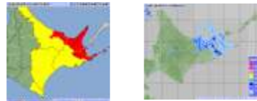
～雨の強さと災害の発生状況～